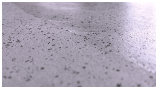
Links unten: ungeschützt