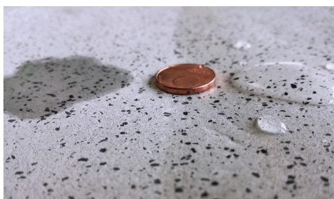
Links: ungeschützt - Wasser dringt ein